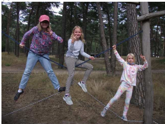
Teilnehmerinnen KiSo 2021

Die Zusammenarbeit mit dem KIEZ Arendsee erfolgte in vollster Zufriedenheit. Pandemiebedingte strenge Regelungen und Einschränkungen konnten in enger Absprache mit den Verantwortlichen umgesetzt werden.