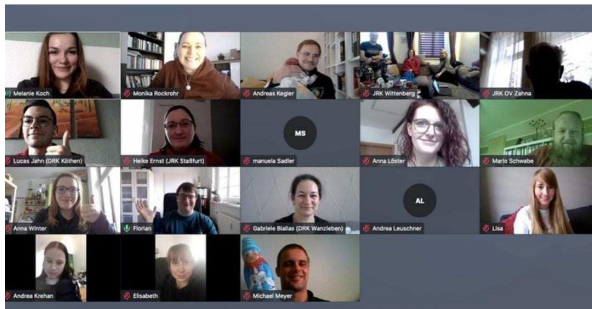
Online JRK-Startschuss 2021

Anfang des Jahres konnten wir online mit dem JRK-Startschuss gemeinsam in das Jahr 2021 starten. 18 Mitglieder versammelten sich vor ihren Kameras, um sich über die aktuelle Situation in ihren JRK- und SSD-Gruppen auszutauschen und die Ziele des JRK Sachsen-Anhalts zu besprechen.