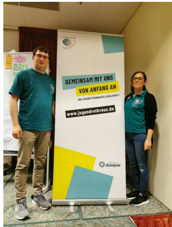
Schulkongress in Berlin

Es kam zum Austausch mit Ehrenamtlichen, Hauptamtlichen sowie Politikern zum Thema ehrenamtliches Engagement fördern, Kooperation im Ganztage, Schule gestalten und aus der Pandemie lernen. Abschluss war eine Podiumsdiskussion mit dem Generalsekretär des Roten Kreuzes Christian Reuter. Hierbei wurde kritisch von den Landesverbänden auch eine politische Unterstützung gefordert um die Koordination der Schularbeit besser etablieren und finanzieren zu können.