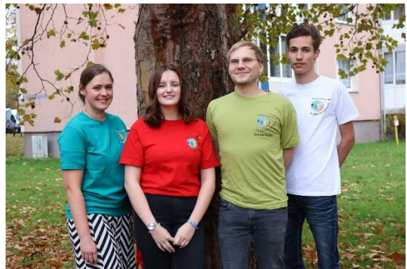
Team in der Landesgeschäftsstelle