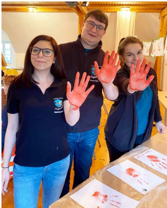
Start Aktion „Rote Hand“ 2020

Auf Grund der gerade zum Jahresanfang anhaltenden pandemischen Lage, haben wir uns dazu entschieden, die eigentlich für dieses Jahr angedachte Fortsetzung der „Aktion Rote Hand“ auf 2022 zu verschieben. Wir werden in unserer Klausur Anfang 2022 darüber beraten, wann und in welcher Form die Aktion fortgeführt wird.