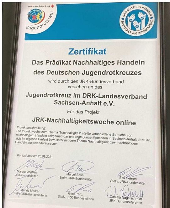
Prädikat „Nachhaltiges Handeln“

Auf Wunsch unserer Mitglieder haben wir uns auch in diesem Jahr wieder mit dem Thema „Nachhaltigkeit“ auseinandergesetzt und haben dies auch auf Bundesebene eingebracht. Ein Ergebnis unserer Arbeit ist, dass seit diesem Jahr sowohl auf Bundes- als auch auf Landesebene das Prädikat „Nachhaltigkeit“ beantragt werden kann.