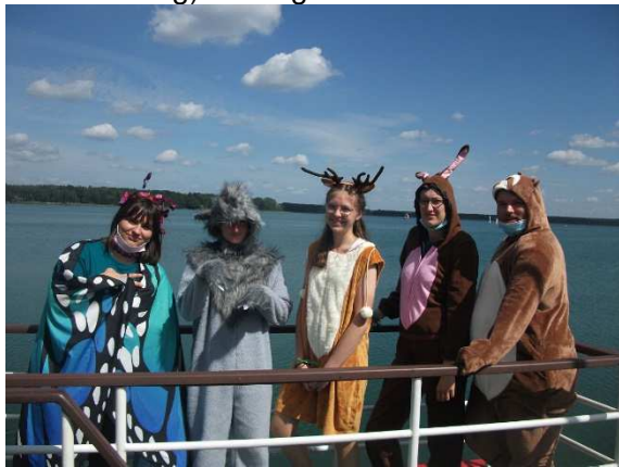
Betreuer_innen am Arendsee

Im Jahr 2021 fand der KinderSommer (kurz: KiSo) zum 31. Mal statt. Es wurde ein Durchgang im Zeitraum 08.08.-21.08.2021 im Kinder- und Jugenderholungszentrum Arendsee (KIEZ) durchgeführt. Insgesamt nahmen 46 Kinder an der Ferienfreizeit teil. Es konnten 15 Betreuer_innen (inklusive Ferienleitung) dafür gewonnen werden.