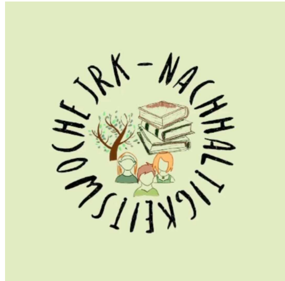
Logo unserer Nachhaltigkeitswoche

tigkeitswoche für das Prädikat „Nachhaltiges Handeln“ beworben und haben das Prädikat verliehen bekommen. Während unserer digitalen Nachhaltigkeitswoche haben wir unter anderem über die verschiedenen Aspekte von Nachhaltigkeit informiert, zu verschiedenen Aktionen aufgerufen und einen Unverpackt-Laden besucht.